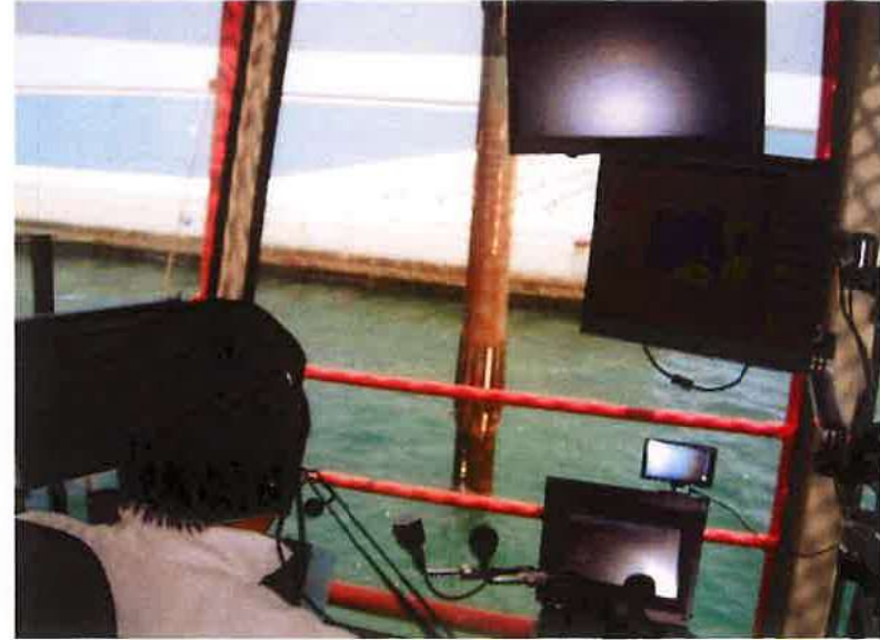
施工状況（起重機船クレーンオペレーター室より撮影）