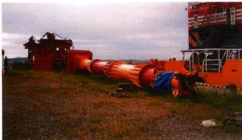
重錘式均し機組立完了