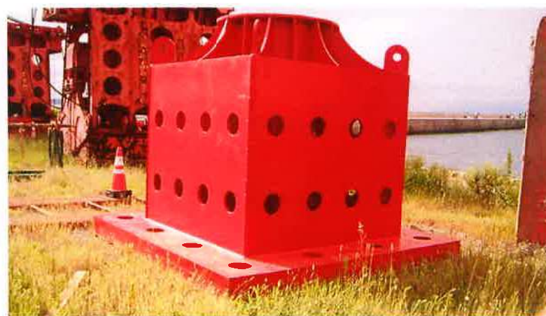
重錘均し機 ヘッド