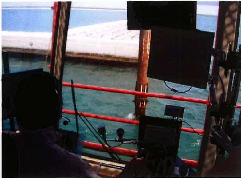
施工状況（起重機船クレーンオペレーター室より撮影）