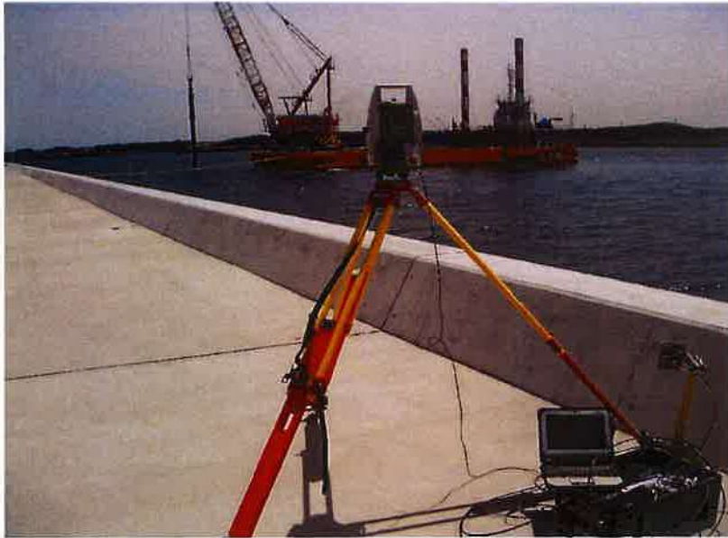
施工状況全景 トータルステーションによる位置及び高さ管理